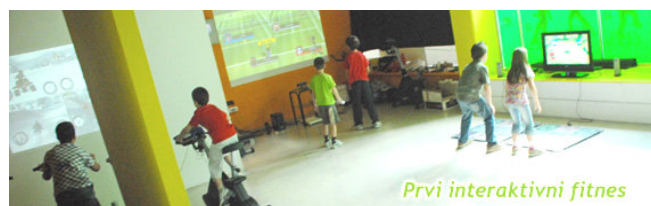
Prvi interaktivni fitnes

sreda, 23. 2., ob 16:00 - prijave do 22.2.